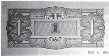
F 232 花束をデザインした1ルーブル券。