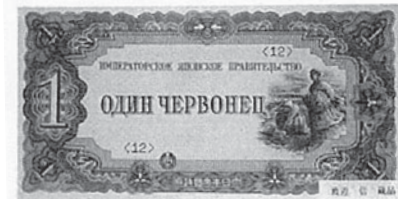
F 230 最高額の1切尔ボネ券。

Номера серий отличаются друг от друга, что свидетельствует о том, что изготовление денежных знаков осуществлялось несколькими партиями.