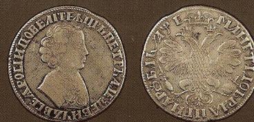
Серебро, диаметр: 43 мм, вес: 27,5 г