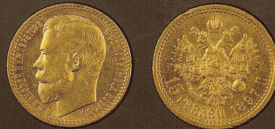
Золото, диаметр: 24,5 мм, вес: 12,9 г