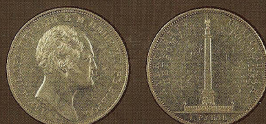
Серебро, диаметр: 35,5 мм, вес: 20,65 г