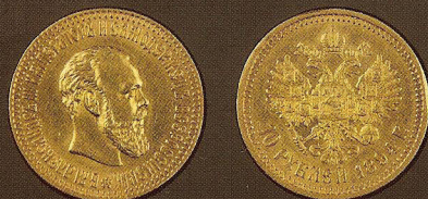
Золото, диаметр: 24,5 мм, вес: 12,9 г