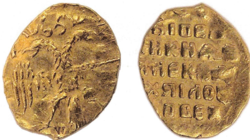
золотой в чет- верть угорско- го. 1654 г. (увеличено)