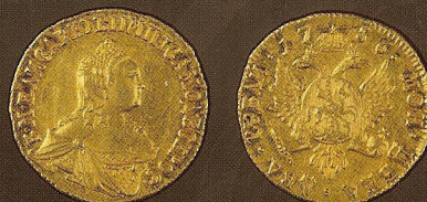
Золото, диаметр: 14 мм, вес: 3,2 г