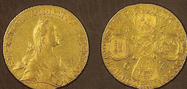
Золото, диаметр: 29 мм, вес: 13 г