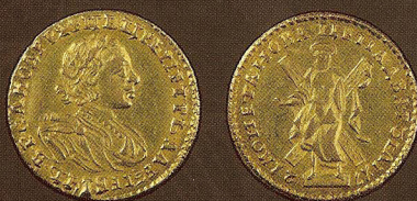
Золото, диаметр: 20 мм, вес: 4,05 г